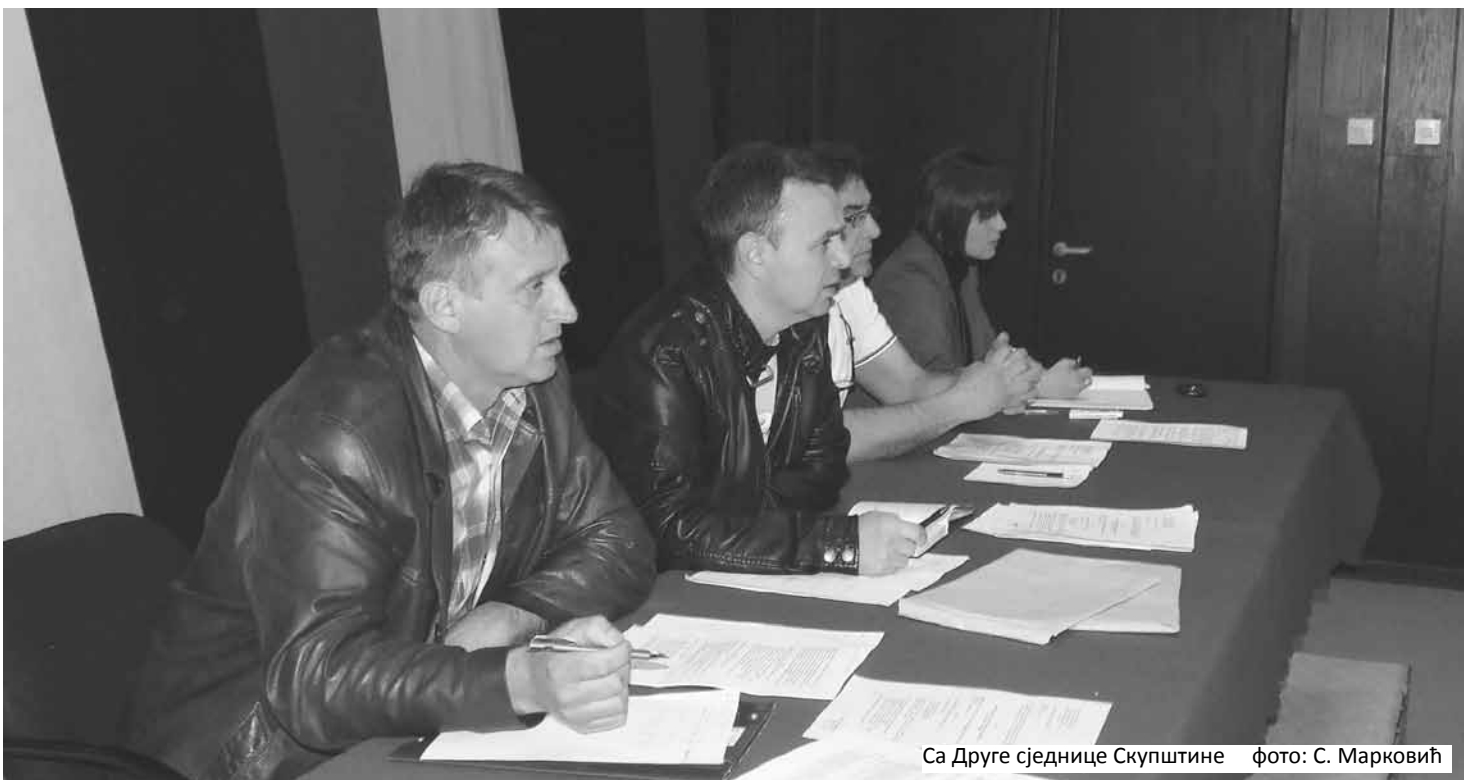
Са Друге сједнице Скупштине

Синдикални одбор на састанку од 12.04.2013. године донио закључак да предложи Скупштини Синдикалне организације "РиТЕ Угљевик" да се за другог потпредсједника Синдикалне организације именује Душко Радовановић, као представник подружнице РЈ "ТЕ".